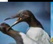
GUILLEMOT MARS À JUILLET