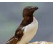
PINGOUIN TORDA MARS À JUILLET