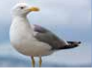
GOÉLAND ARGENTÉ TOUTE L'ANNÉE