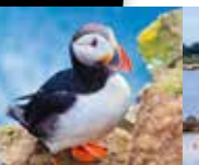
MARS À JUILLET