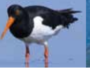
HUÎTRIER PIE TOUTE L'ANNÉE