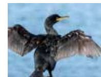
CORMORAN HUPPÉ DÉCEMBRE À AOÛT

In the mornings you will see more birds and keen photographers will find the light is better.