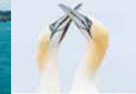
FOU DE BASSAN FÉVRIER À OCTOBRE