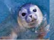
PHOQUE GRIS TOUTE L'ANNÉE